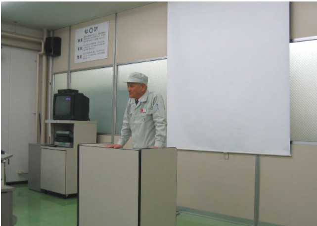
㈱太洋工作所の社長様