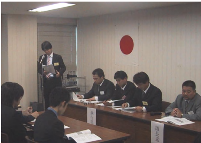
名鍍会笠間敦嗣幹事現況報告