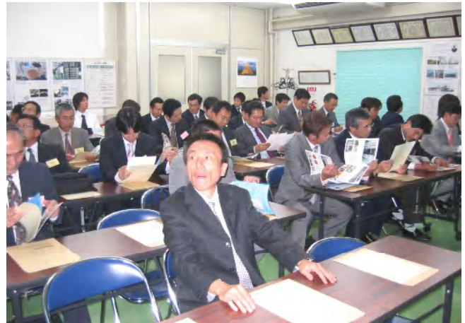
工場見学説明会の様子