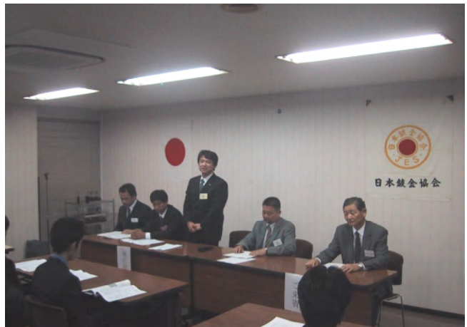
前川副会長閉会の辞