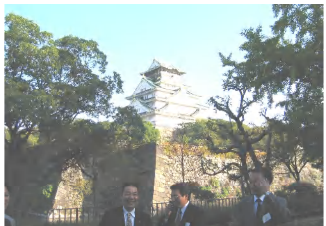
大阪城にたちよる